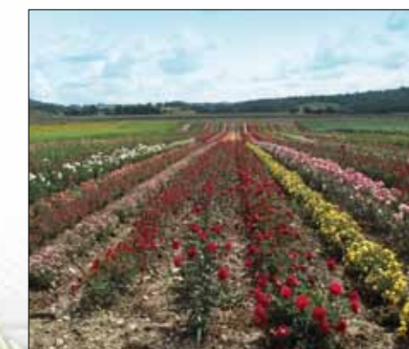
Cultures de rosiers ou plantations en massif