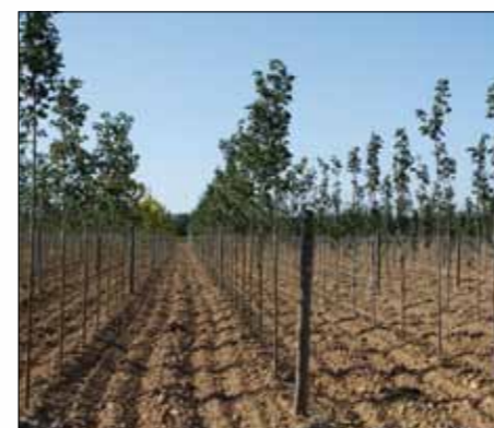
Cultures pleine terre ou plantations en massif

➤ DITHANE Paysage™ laisse un léger dépôt jaunâtre sur les feuilles. En culture florales on pourra stopper les traitements un mois avant la commercialisation des plantes. Eviter les projections de DITHANE Paysage™ sur les supports minéraux tels que murs, dalles, etc... car le produit les tache de façon irréversible.