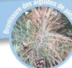
Brunissure des aiguilles de pins