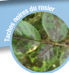
Taches noires du rosier