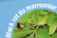
Black rot du marronnier