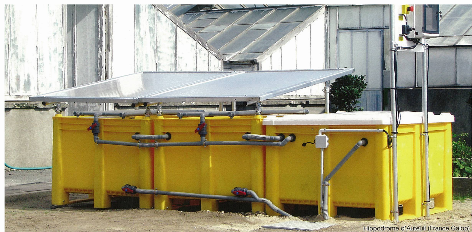
Hippodrome d'Auteuil (France Galop)