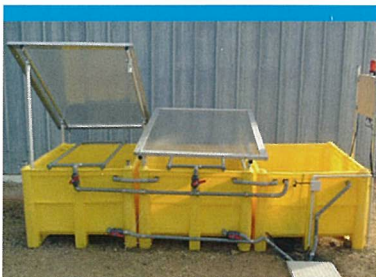
Phytobac® "Petit Volume"

Ce Phytobac®, reposant sur une structure en béton, est adapté pour le traitement de volume d'effluents plus important, avec une capacité allant de 2 m 3 à 10 m 3 en fonction du besoin exprimé.