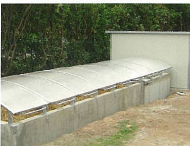
Phytobac® "Grand Volume"