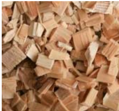
Plaquette Résineux Écorcé